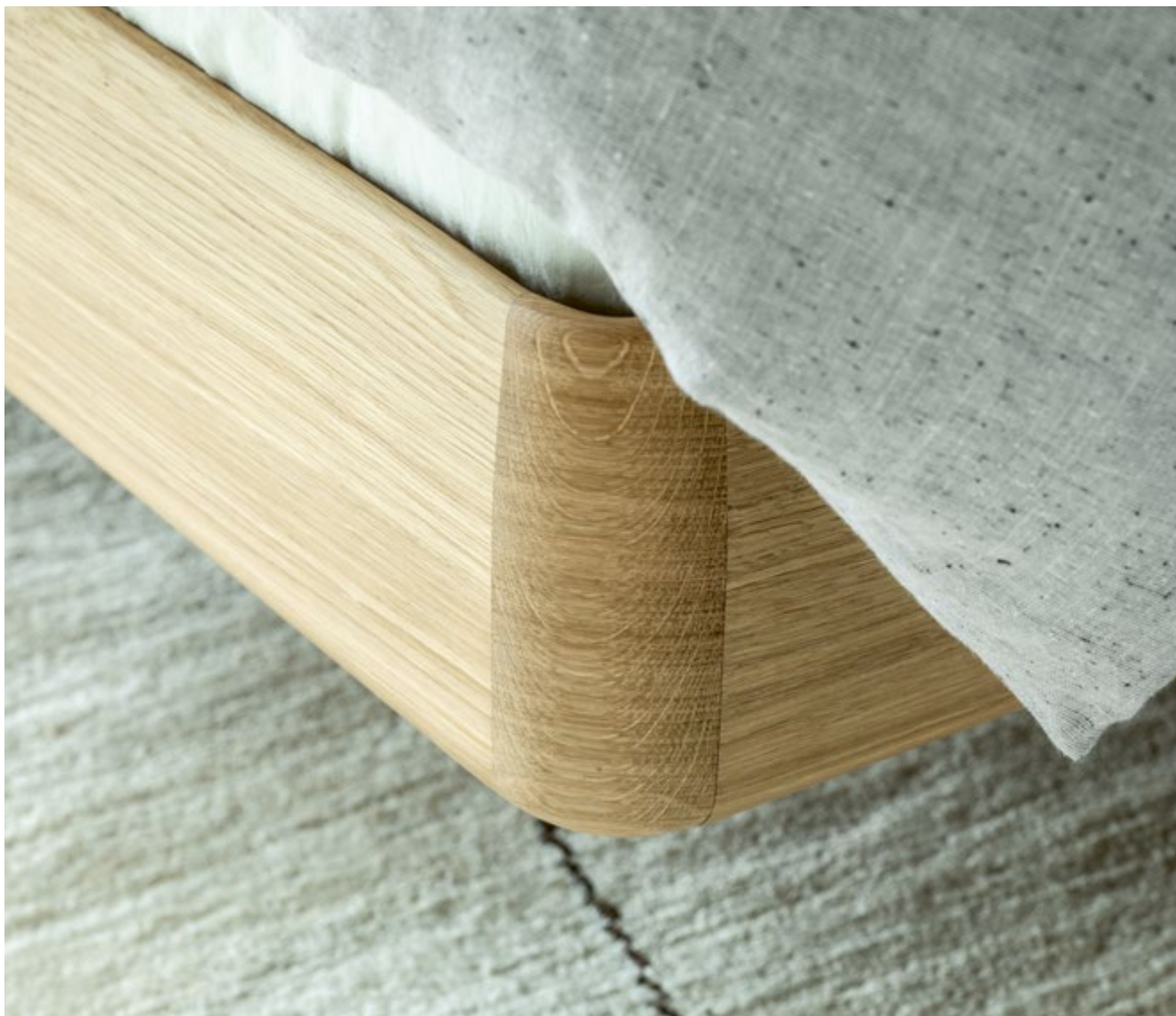
BLOW Bett / Bed 160 x 200 cm

Stoff Profile (Creme), Eiche hell geölt / Fabric Profile (cream), oak light oiled