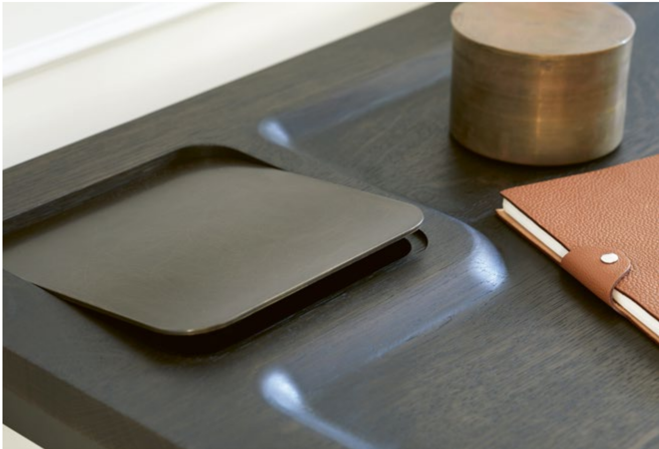
LAX Sekretär / Writing desk 135 x 50 cm

Eiche Graphit, Stahl anthrazit pulverbeschichtet, Messing gebürstet / Oak Graphite, steel anthracite powder-coated, brass brushed